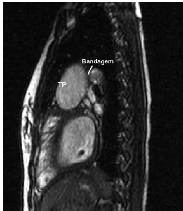
Fig. 2 – Aneurisma do tronco pulmonar e estenose de ramos pulmonares causados pela bandagem TP - Tronco pulmonar

Na reoperação, com circulação extracorpórea a 20°C, o tronco pulmonar aneurismático (6 cm) foi dissecado e seccionado. A valva pulmonar, muito dilatada, foi fechada com retalho de homoenxerto pulmonar e o coto proximal do tronco pulmonar foi fechado com dupla sutura. O coto distal do tronco pulmonar foi fechado com retalho de homoenxerto pulmonar com sutura (Figura 2). A artéria pulmonar esquerda foi ampliada com retalho de homoenxerto pulmonar. A recuperação pós-operatória (PO) foi satisfatória, a criança foi extubada no 1º PO e recebeu alta hospitalar no 14º PO.